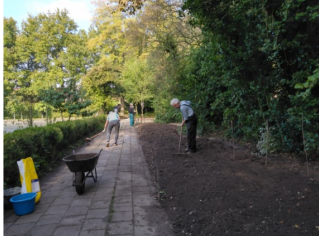
Vorbereiding van de bodem, met kalk en bentoniet