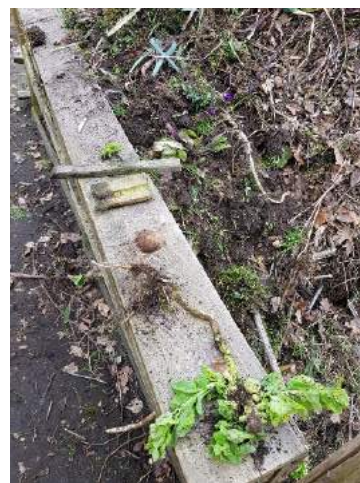
bamboestokjes, aardappel, kool