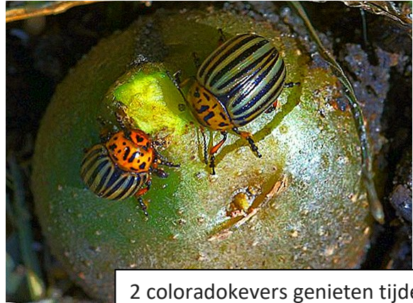
2 coloradokevers genieten tijdens hun vakantie in Driebergen