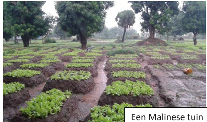
Een Malinese tuin

We krabben in maart lang niet alles weg. Eigenlijk gaat het krabben heel langzaam omdat we elk voorjaar zoveel leuks aantreffen. Viooltjes gaan naar de zijkant, net als wintertarwes, want die moeten weer aren produceren voor de volgende groenbemesting, etc. Bieslook doet het ook erg goed qua randvorming, heb ik gemerkt.